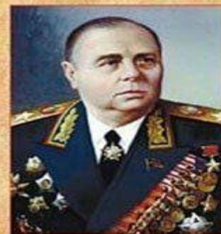
Мерецков К. А. (1897-1968)