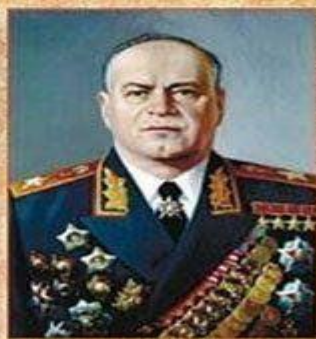
Жуков Г.К. (1896-1974)