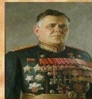
Ерёменко А.И. (1892-1970)