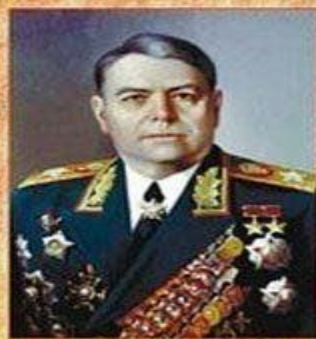
Василевский А.М. (1895-1977)