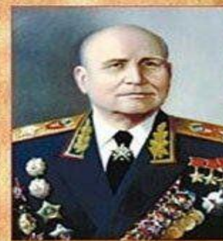
Конев И.С. (1897-1973)