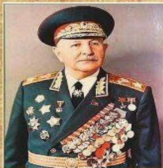
Баграмян И. Х. (1897-1982)