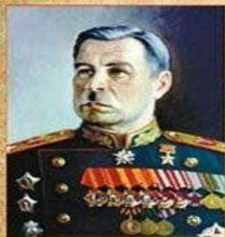
Говоров Л.А. (1897-1955)