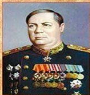
Толбухин Ф.И. (1894-1949)