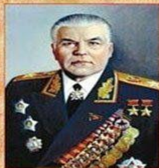
Малиновский Р. Я. (1898-1967)