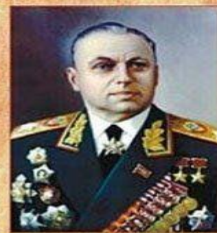
Рокоссовский К.К. (1896-1968)