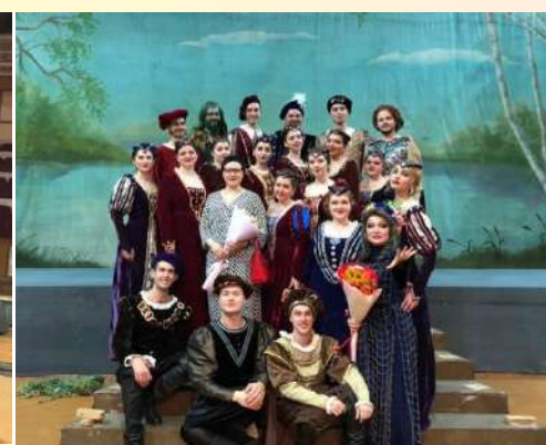
камерный хор ДГМА

Опера вызвала множество положительных эмоций и впечатлений у всех участников и зрителей спектакля, а также была отмечена прессой и телевидением. Несмотря на сложность музыкального материала, все исполнители уверенно справились со своей задачей и воплотили на сцене Донбасс-Опера настоящую лирико-фантастическую сказку, которая очень полюбилась зрительской аудитории и обязательно должна войти в репертуар оперного театра. Ведь не зря, после первого исполнения оперы в Чехии (1901), газета «Народни политика» опубликовала следующий отзыв: «Известный лидер чешского современного музыкального движения написал для нас настоящую национальную сказочную оперу, свет которой, несомненно, проникает в будущее!».