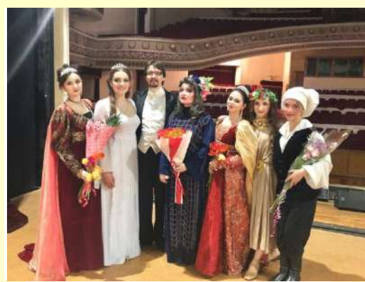
солисты оперы с дирижёром