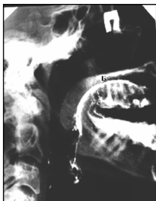
Рис. 1. Смыкание мягкого нёба и корня языка отмечено на участке А – Б

Понижение начальной концентрации кислорода с 20,9 % до 19 % и увеличение углекислого газа с 0 до 1,5 % связано, по-видимому, с тем, что при ПВ ротового вдоха не существует, и данные величины фактически возникают во время начала естественного выдоха через рот, когда насыщенный кислородом воздух, находящийся в глотке, смешивается с остатками воздуха, оставшегося в полости рта после искусственного выдоха.